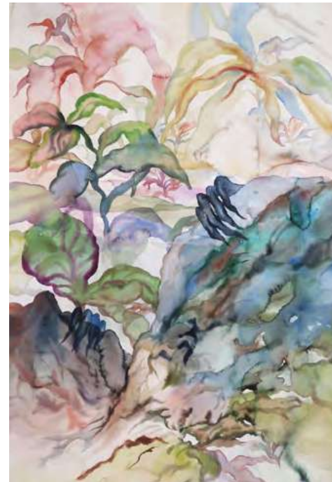
Makiko Furuichi, Recouvrement , 2022 © Adagp, Paris, 2023