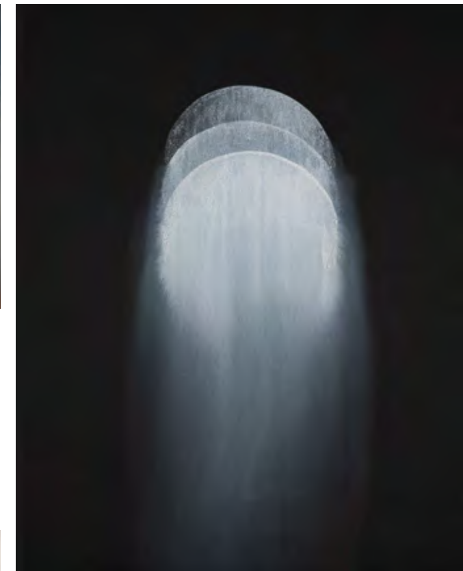
Guillaume Colussi, Les classés , 2021