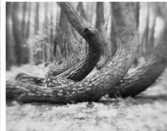
Mali Arun, KRZYWY LAS (Forêt tordue) , 2022, vidéo © Mali Arun