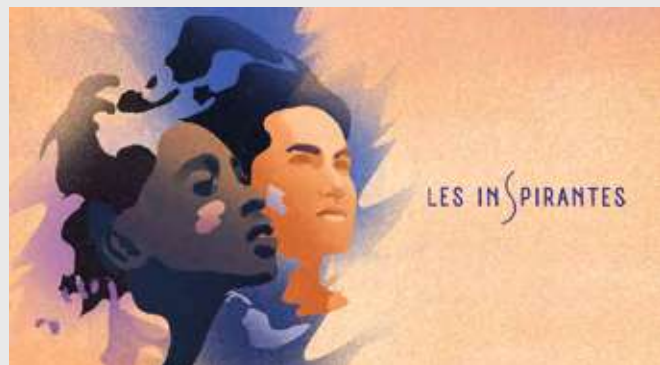
Table ronde et concert dans le cadre des Inspirantes

La promenade des sens Mercredi 31 mai | 9h30–12h30 Regarder et toucher Jedi 8 juin | 15h–18h Sentir et écouter Jedi 22 juin | 15h–18h Goûter et se souvenir Mercredi 28 juin | 9h30–12h30 Adultes : 7 €/3,5 € par séance | Possible de s'inscrire à 1 atelier ou plusieurs – Réservation obligatoire