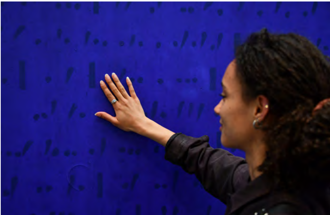
Cécile Le Talec, Bruit bleu (détail), 2022 © Musées d'Angers, D. Riou © Adagp, Paris 2023