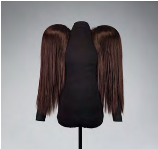
Maison Margiela, Wig jacket , Défilé Collection, Spring – Summer 2009, Maison Margiela