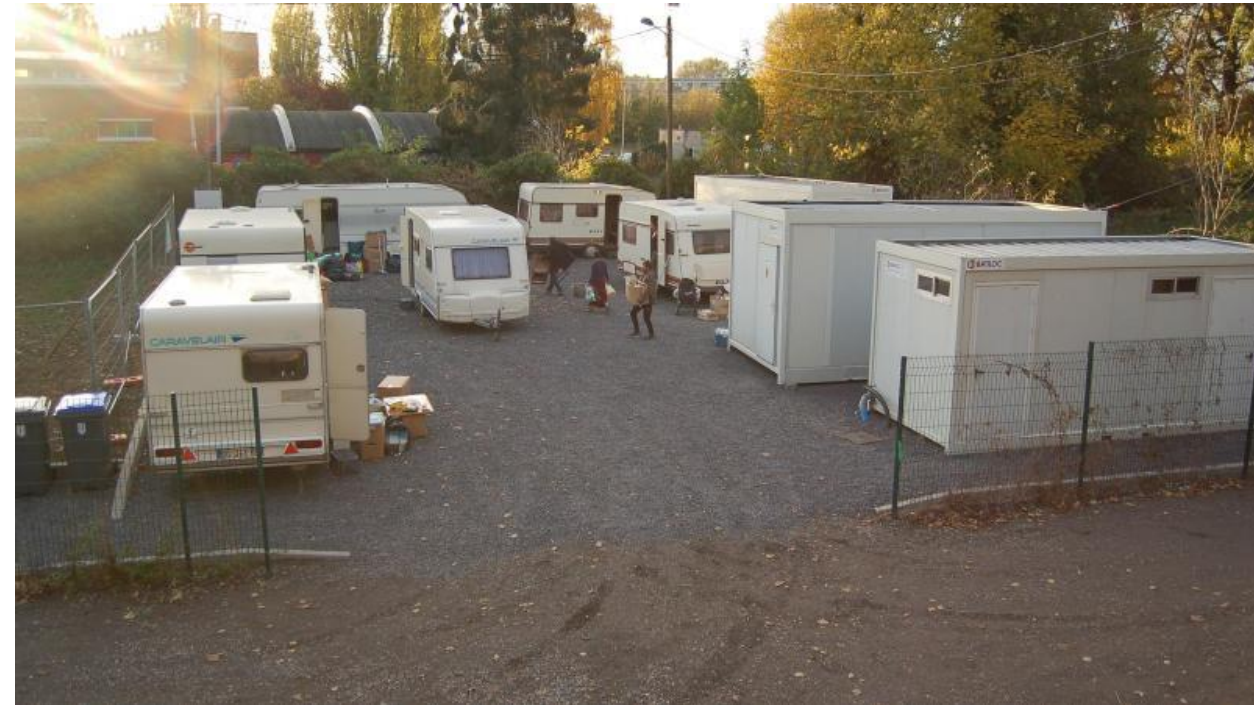
Exemple : S.A.T. de Lambersart (Métropole européenne de Lille)