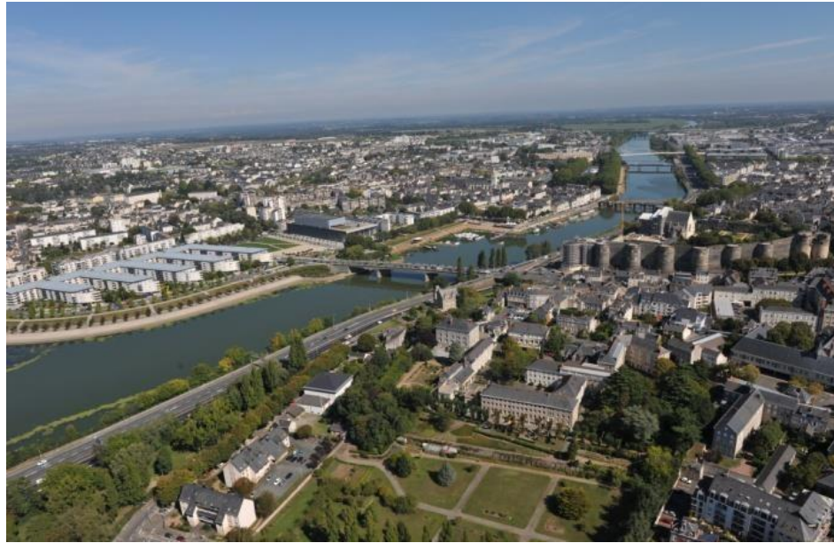
Schéma directeur des paysages angevins 2019-2025 et Plan nature en ville 2021-2025

« Connaitre, préserver et développer le patrimoine arboré »