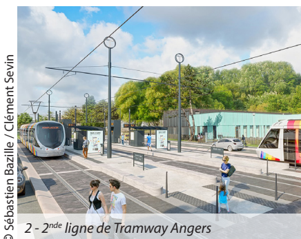
© Sébastien Bazille / Clément Sevin