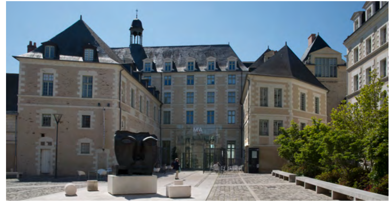
Musée des Beaux-Arts