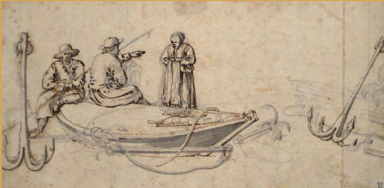
Pêcheurs au repos sur une barque échouée, Willem (I) van de Velde, vers 1645-1650, Angers, musée des Beaux-Arts