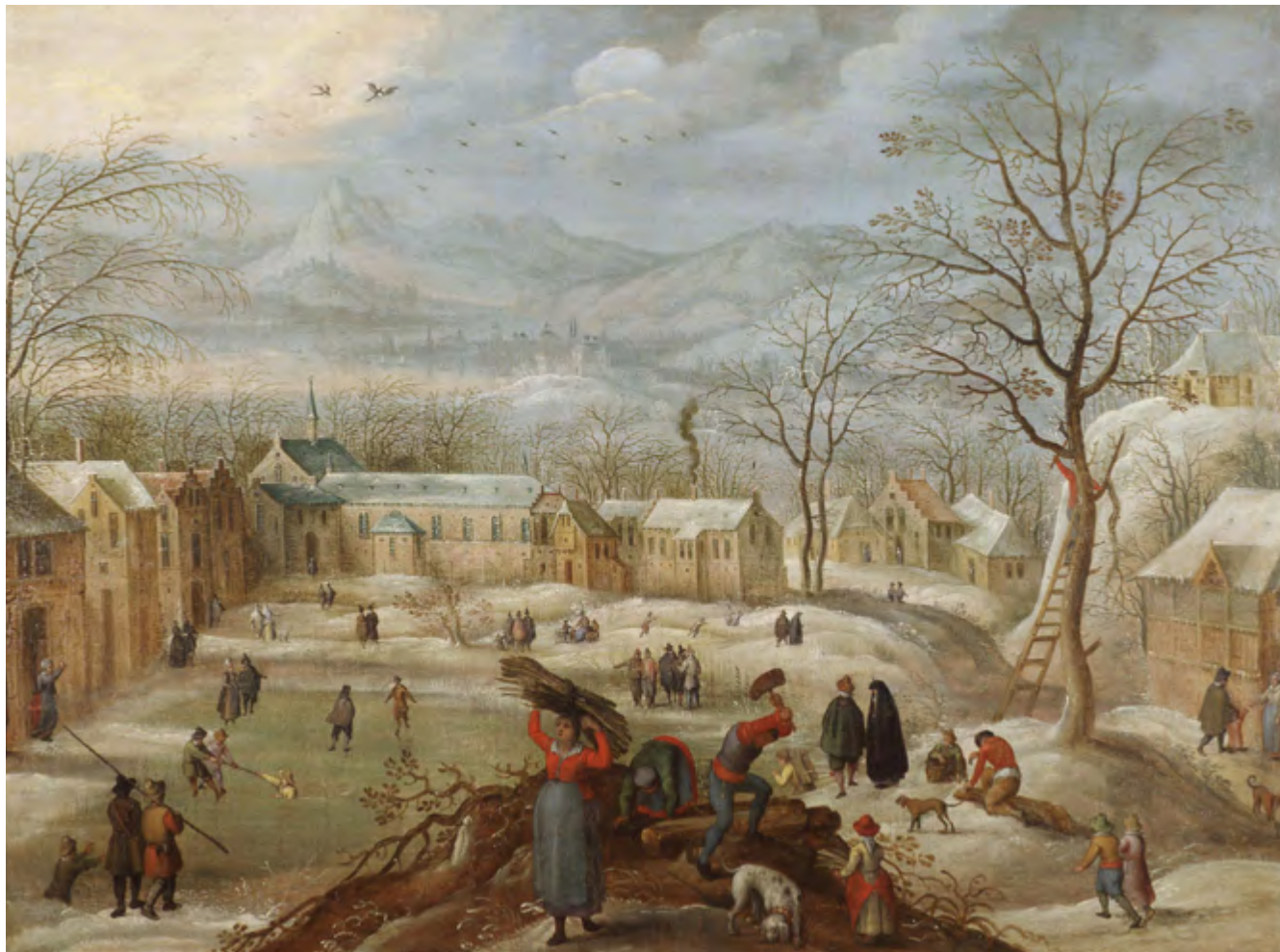
Les Quatre Saisons : l'Hiver, attribué à Peter Snayers, vers 1613 Tours, musée des Beaux-Arts