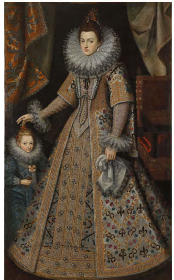
↑ Portrait de l'archiduchesse Isabelle d'Autriche, souveraine (1598-1621) puis gouvernante des Pays-Bas espagnols (1621-1633), copie d'après Frans (II) Pourbus, dit le Jeune, vers 1603, Le Mans, musée de Tessé

Dans un souci de pédagogie, l'exposition présente au public, à côté des œuvres, des matières premières et des matériaux textiles – dont certains sont à toucher –, accompagnés de vidéos délivrant des explications techniques, manière d'insister sur la matérialité des vêtements.