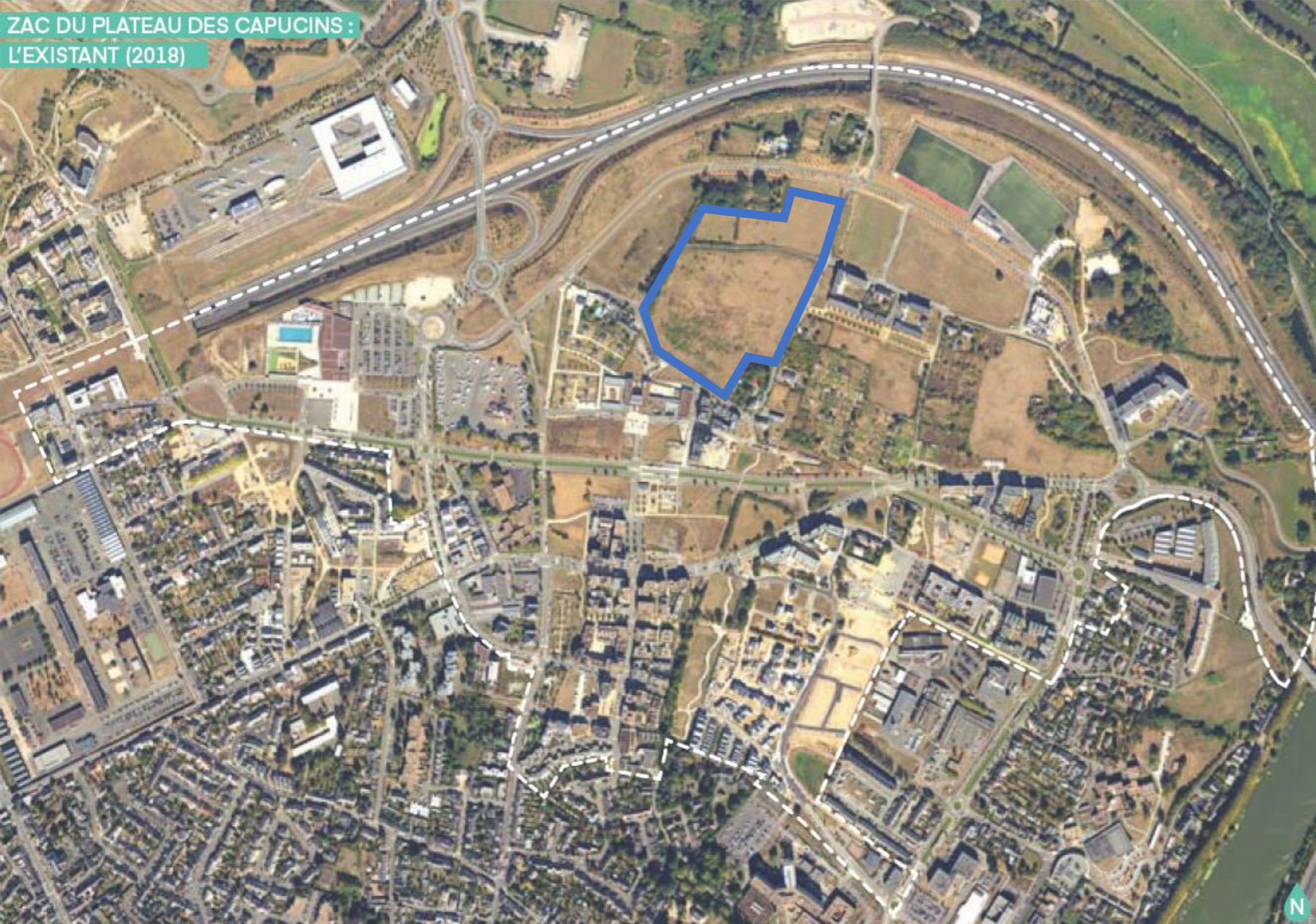
ZAC DU PLATEAU DES CAPUCINS : L'EXISTANT (2018)