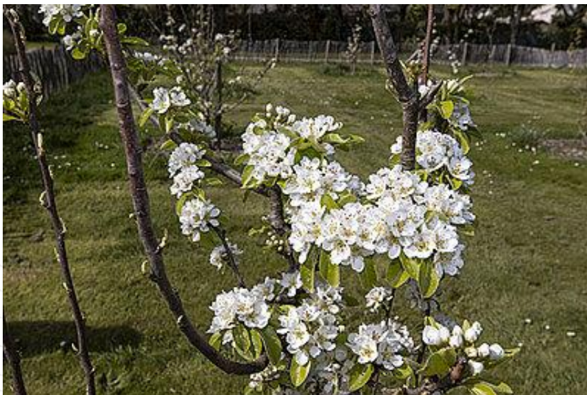
Type d'arbres plantés