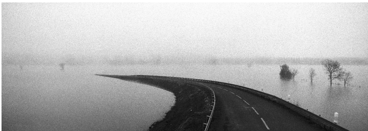
RD 109, Briollay, janvier 2022, photographie argentique, 42 × 120