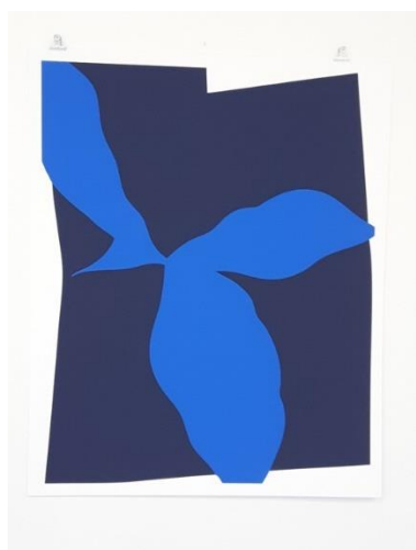
Frédéric Bouffandeau Sans titre, 2019 Digigraphie Collection Artothèque d'Angers, ©Ville d'Angers, musées d'Angers

Renseignements/Inscriptions 02 41 05 59 65