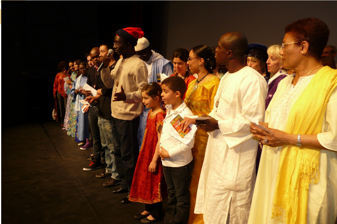
Cérémonie de clôture du festival 2011

L'ouverture et la clôture du festival sont l'occasion de soirées festives au Centre de Congrès d'Angers et de projections de films.