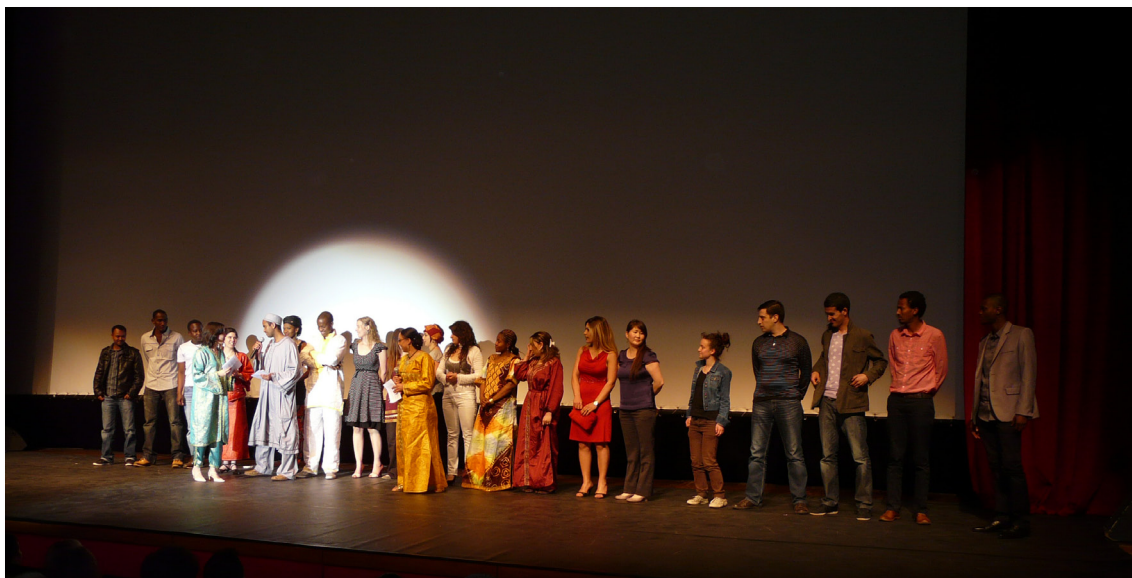
Jury jeune attribuant le prix du meilleur long métrage