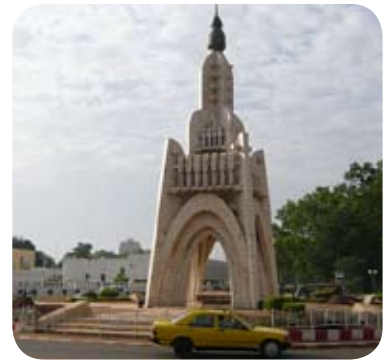
monument de l'indépendance Bamako