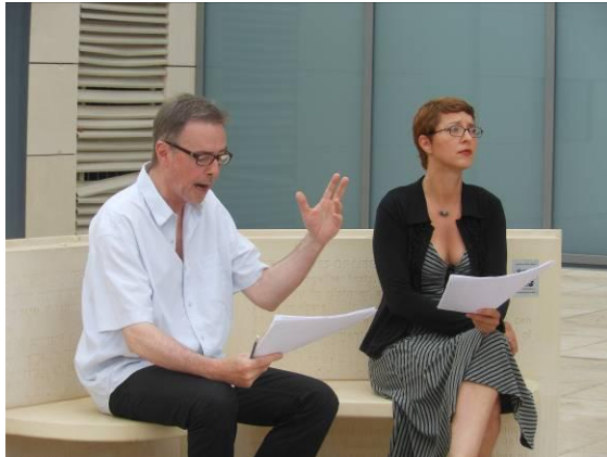
Lecture publique de l'association L'ESQUIF

Le calendrier national fait la promotion de tous les événements littéraires (marchés aux livres, festivals, rencontres littéraires).