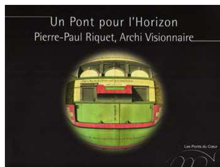
Un Pont pour l'Horizon, 2007-2008