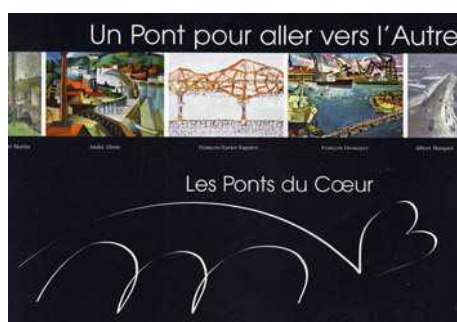
Un Pont pour aller vers l'Autre, 2005-2006