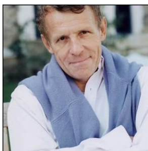
Patrick Poivre d'Arvor

Parrain officiel des Bancs de la Liberté