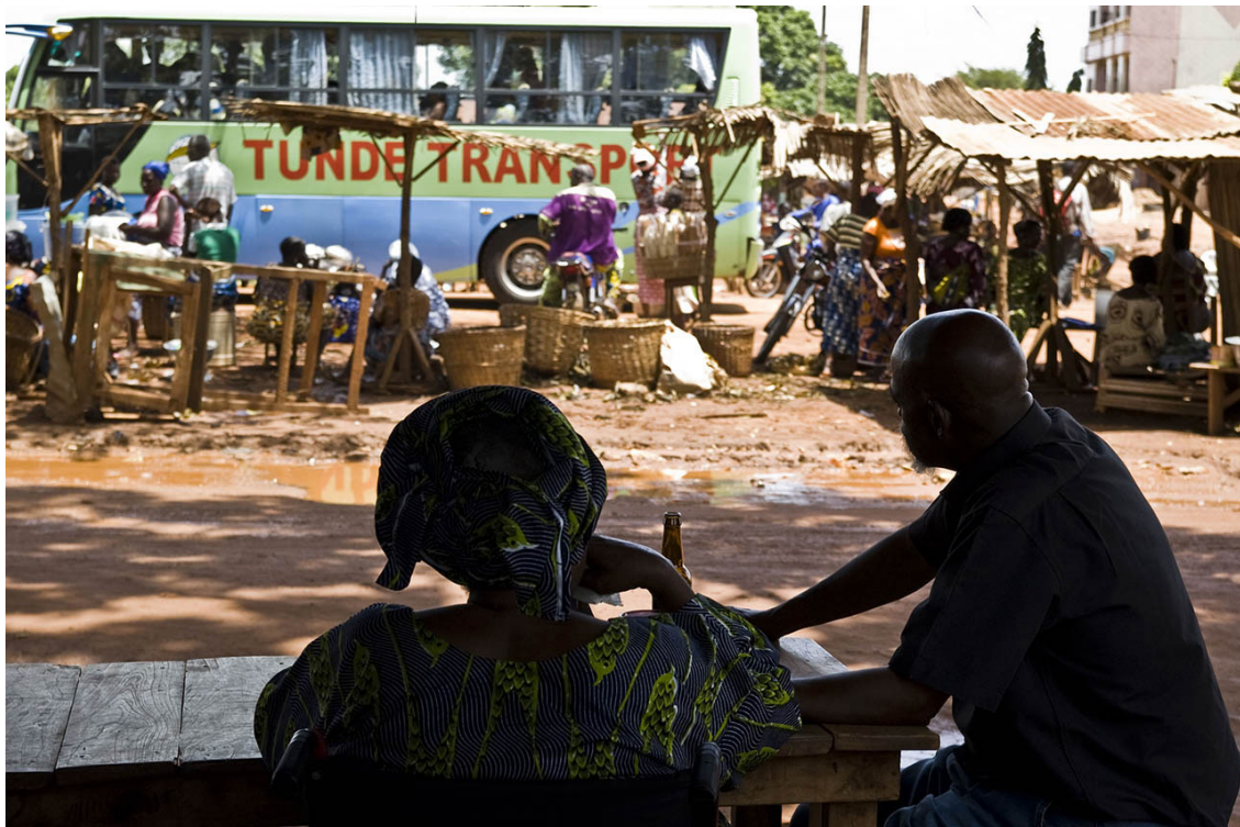
Visuel extrait du film La porte du non-retour

Alphonse Zannou a quitté le Bénin il y a trente-sept ans. Plein de regrets, il décide enfin de revenir à sa terre natale, accompagné de son fils, qui filme le voyage. Un retour au pays en quête de retrouvailles, de pardon et de réconciliation avec sa famille et avec lui-même. Et qui permet aussi la transmission à son fils de ses racines africaines.