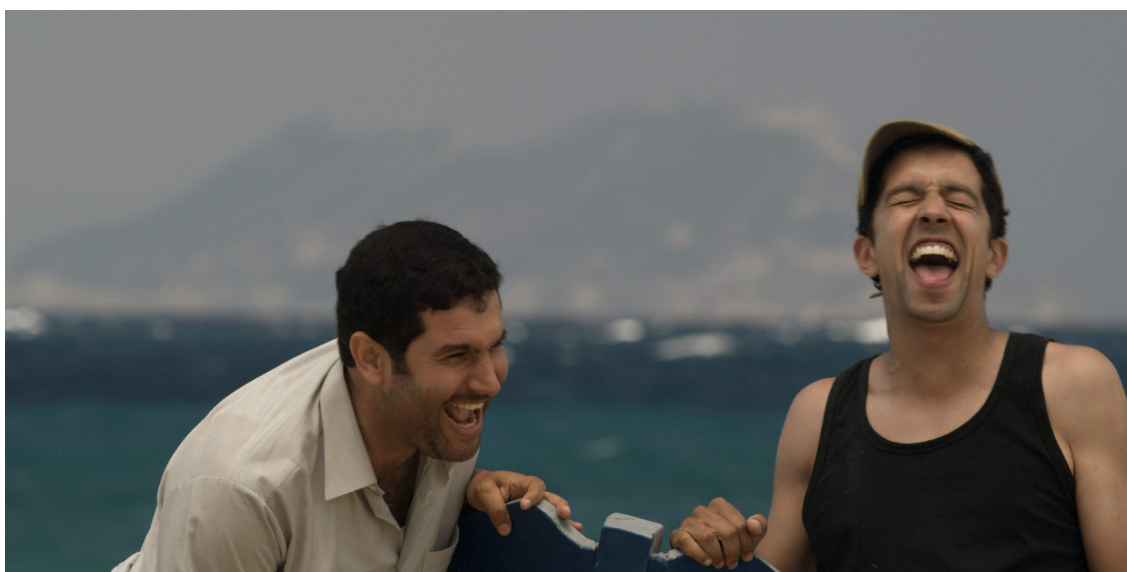
Visuel extrait du film Andalousie, mon amour !

Un petit village de la côte marocaine. Deux étudiants qui rêvent d'Europe prennent une barque pour l'Espagne, avec la complicité de l'instituteur. L'un d'eux échoue en Espagne... dans une Andalousie plus qu'étrange. Pendant ce temps, au village, trafics et combines des notables vont bon train. Comédie populaire où la satire poussée à l'extrême moque une société qui se cherche, à travers des situations quasi surréalistes.