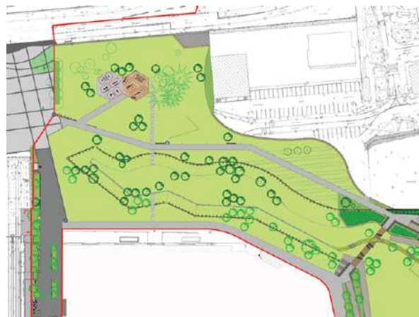
Plan des aménagements réalisés à l'entrée du parc, côté Maine.

Les travaux d'aménagement de l'entrée du parc ont commencé en juillet 2019 et se sont terminés au mois de mai.