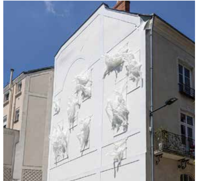
Distortion, Recycle Group, plastique thermoformé, 2024

Dans le cadre de travaux d'amélioration de logements d'Angers Loire Habitat, la fresque Yaye disparaît. La Ville d'Angers et le bailleur social confient au collectif La Douceur la création d'une nouvelle œuvre, issue d'échanges avec les habitants et financée par la Fondation Bouygues Immobilier. Réalisation en juin 2025.