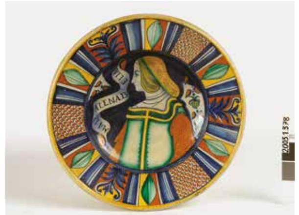
Plat : Femme de profil, atelier de Deruta d'après Pintoricchio, 1500-1535, faïence, legs Duclaux en 2003

Cette exposition sera l'occasion de partager avec le public de rares et délicats chefs d'œuvre des collections angevines (Rubens, Poussin, Friedrich).