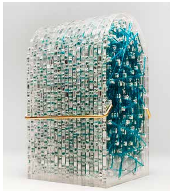
Robin Jespierre, Imbroglia XI © Adagp, Paris 2025

En complément, une sélection d'œuvres acquises à l'issue des précédentes éditions seront exposées. Elles viennent accroître un fonds muséal déjà riche de plus d'une centaine de « petites » œuvres.