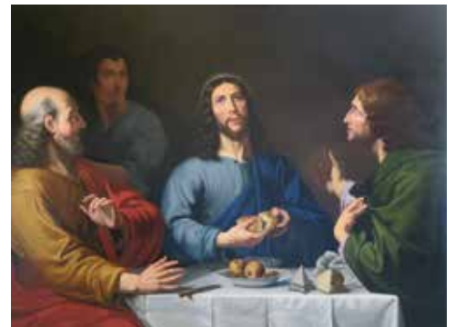
Le souper d'Emmaüs, église Saint-Joseph © Ville d'Angers

La Ville d'Angers possède une collection d'objets d'art principalement conservés dans des églises, de nature diverse : peintures de chevalet, peintures murales, objets liturgiques, sculptures, textiles etc... L'exposition sera l'occasion de découvrir le travail de conservation et de restauration mené autour de ces trésors souvent méconnus.