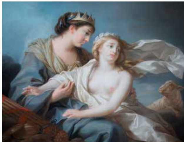
Élisabeth Vigée Le Brun, L'Innocence se réfugiant dans les bras de la Justice , 1779

Les musées d'Angers conservent quinze dessins et miniatures de la collection Livois, tous datés du 18 e siècle. Le pastel de Vigée Le Brun est accroché aux côtés d'autres œuvres issues de la collection Livois et de quelques-unes créées par des femmes artistes.