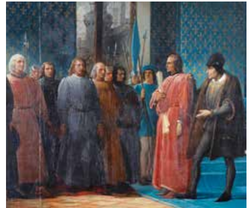
Louis XI présentant aux notables angevins Guillaume de Cerizay en qualité de maire, 1474, Ville d'Angers, hôtel de ville

Le CIAP (Centre d'interprétation de l'architecture et du patrimoine) célèbre le 550 e anniversaire de la fondation de la mairie d'Angers. Les deux chartes originales seront exposées, ainsi qu'une sélection de documents et d'objets des Musées, des Archives et des Bibliothèques d'Angers, qui permettront au public de découvrir ce pan d'histoire médiévale de la ville.