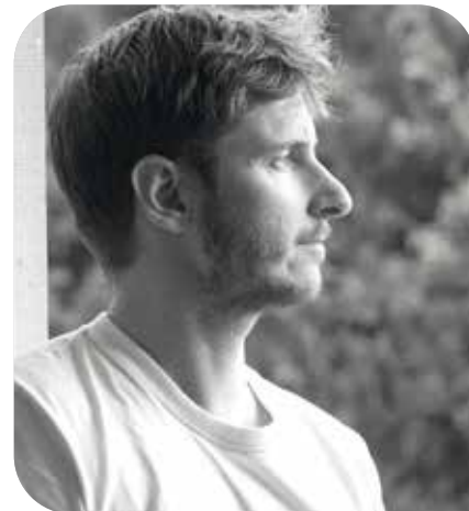
Valentin Broquaire @vincentbroquaire

Le dessin est au cœur de la pratique de Vincent Broquaire. À partir d'un vocabulaire graphique minimal, souvent en noir et blanc, il construit des images d'une grande précision où se déploient des scènes énigmatiques, habitées par de petites figures anonymes.