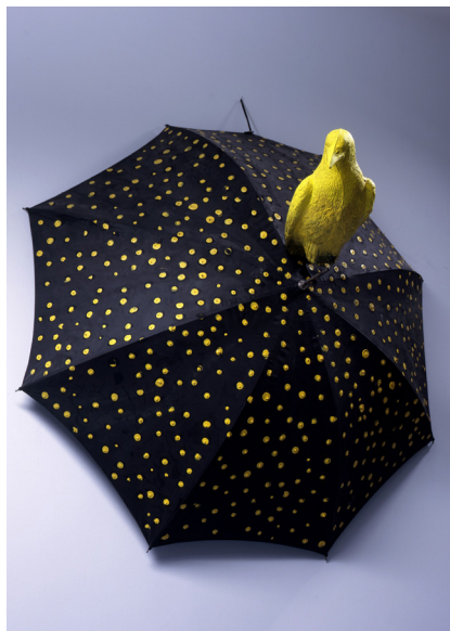
Sans titre (parapluie et oiseau) Daniel Tremblay, 1981.

Réparties dans le secteur du grand centre-ville, des reproductions d'œuvres d'art des collections des musées de la Ville d'Angers seront visibles dans les commerces du centre-ville (vitrophanies) et sur deux façades de l'Université.