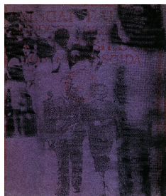
7- Bracha Ettinger, No title-sketch n°6 , 1985, technique mixte sur toile, 27,3 x 32,1 cm, collection particulière