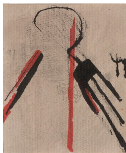
5- Bracha Ettinger, Sans titre , 1986, dessin / technique mixte, 20,3 x 16,8 cm, collection particulière