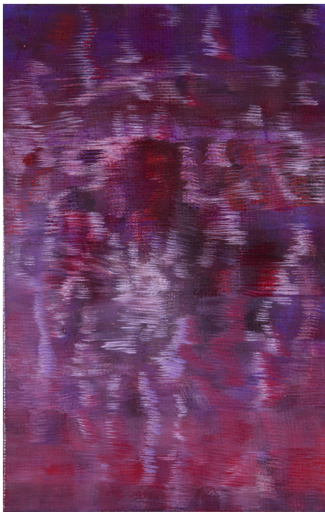
Bracha Ettinger, Ophélie et Eurydice n°2 , 2002-2009, huile sur toile, Angers, musée des Beaux-Arts