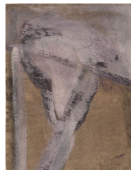
6- Bracha Ettinger, Sans titre , 1989, dessin / technique mixte, 31,6 x 24,3 cm, collection particulière