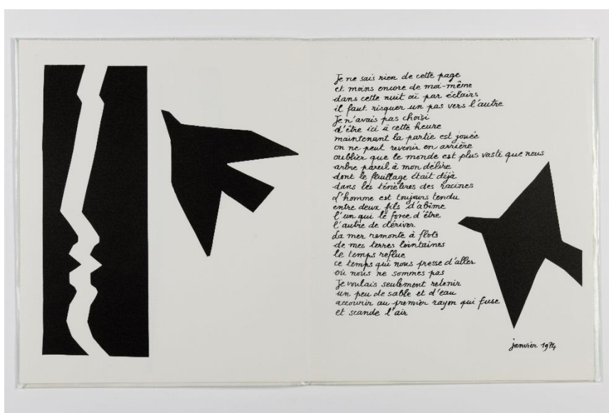
Jean-Pierre Geay, Nous ne saurons jamais . PAB, 1974. Découpages et collages de Pierre André Benoit.

Un film documentaire réalisé par la vidéaste Thésée ( http://www.arthesee.org/ ) sera aussi présenté au cœur de l'exposition : Habiter l'espace. Jean-Pierre Geay et ses amis peintres explique la démarche du poète avec ses amis peintres. C'est un dialogue entre les images des œuvres peintes et les textes poétiques, nourri des témoignages de l'artiste, d'anecdotes, de commentaires et de lectures poétiques (durée 1 heure).