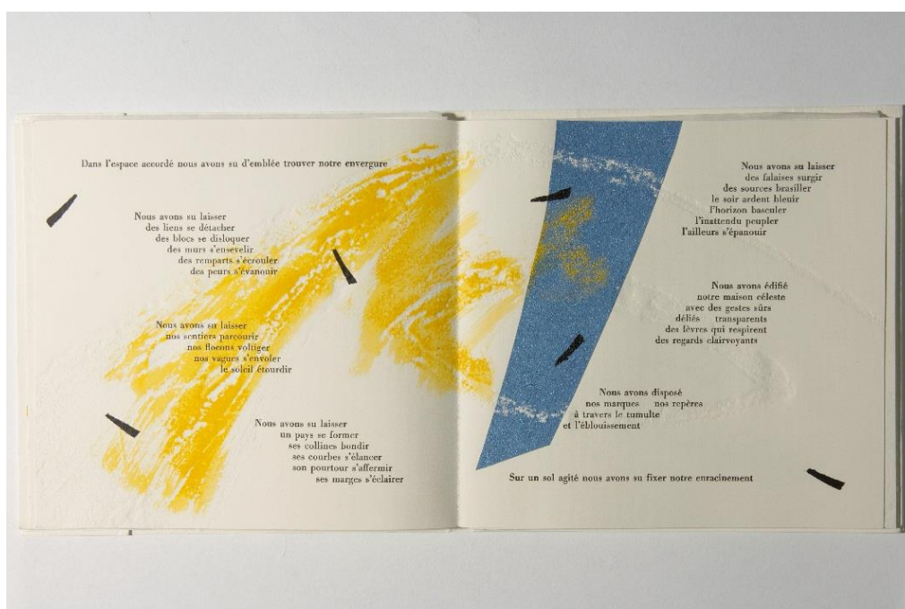
Jean-Pierre Geay, L'étendue sillonnée. Atelier du mot, 2003.

Entre 2011 et 2013, Jean-Pierre Geay, agrégé de lettres modernes, poète et critique d'art, ayant partagé sa vie entre la Provence et l'Ardèche, a fait une donation exceptionnelle à la Bibliothèque municipale d'Angers de plus de 3000 documents rassemblant l'ensemble de son œuvre poétique et bibliophilique et toutes les archives : correspondances, maquettes de livre, gravures, dessins, peintures permettant de comprendre la genèse de son œuvre et ses collaborations avec une quarantaine de plasticiens.