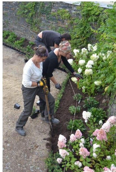
Château d'Angers, fleuri