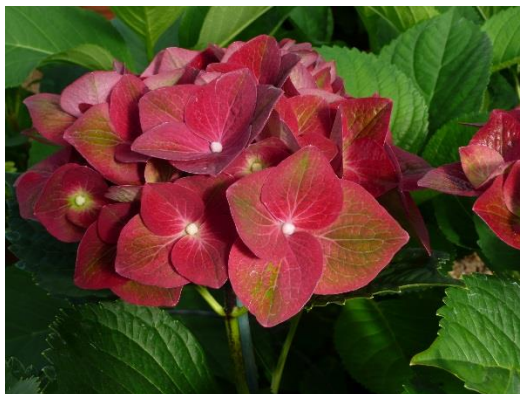
Hortensia 'Green shadow'

L'Hydrangea, d'origine asiatique et américaine, est composée de 23 espèces selon la classification européenne. L'espèce la plus répandue en Europe est Hydrangea macrophylla ou hortensia, originaire du Japon.