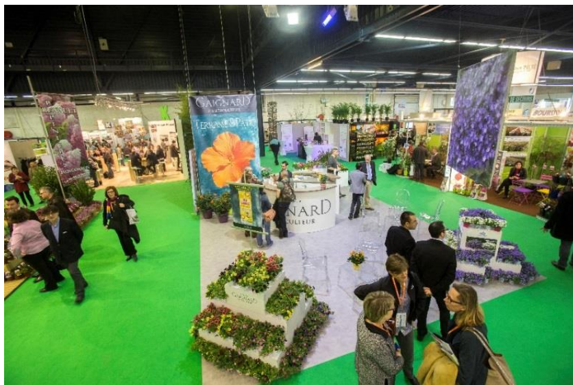
Salon du Végétal 2014 : Stands et allées

Partenaire pour la quatrième année, Angers Loire Métropole soutient financièrement le Bureau Horticole Régional (BHR) pour l'organisation du Salon, reconnaissant ainsi son rôle primordial dans le rayonnement de notre filière en France et à l'international.