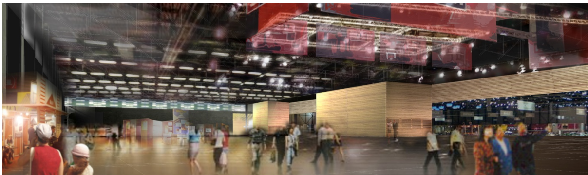
Vue du nouveau hall © Cabinet GONFREVILLE-DUMET- VAULET

À l'instar du SIVAL, de nombreux salons sont organisés tout au long de l'année au sein du Parc des Expositions. Ils permettent de faire rayonner le territoire au niveau national, voire international dans le cas d'événement de l'importance du SIVAL. Avec plus d'espace et de meilleures conditions d'accueil, les retombées n'en seront que meilleures pour le territoire angevin.