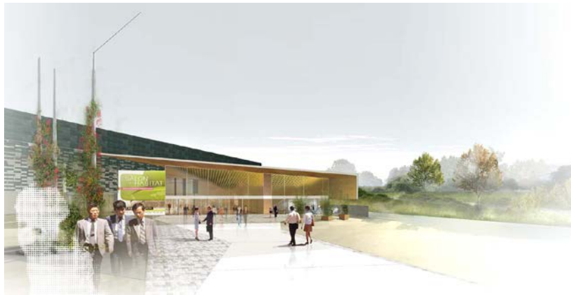
La nouvelle entrée © Cabinet GONFREVILLE-DUMET-VAULET

Cette opération dont le montant s'élève à 7,8 M€ hors taxe s'inscrit dans la continuité de celles déjà initiées pour maintenir le site opérationnel avec, en 2008, la restructuration et l'extension de la salle AMPHITEA pour un montant de 6,7 M€. Des travaux qui vont permettre au Parc des Expositions de s'offrir une nouvelle jeunesse.