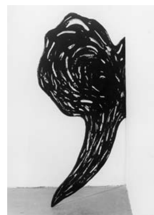
Peter Briggs, Black Visitation , 1982

A travers des formes biomorphiques ou baroques, quelquefois industrielles, elles montrent son intérêt pour des binômes qu'il a inventés ou réinventés, des processus agissant sur des matières, tels le sciage au fil du marbre, la découpe du verre et de l'obsidienne 1 , la fonderie à la cire et bois perdus pour produire des fontes de fer : autant de techniques croisées qui posent les bases de production de ce que Briggs ne cessera de développer par la suite dans une prolifération en cascade à peine contenue.