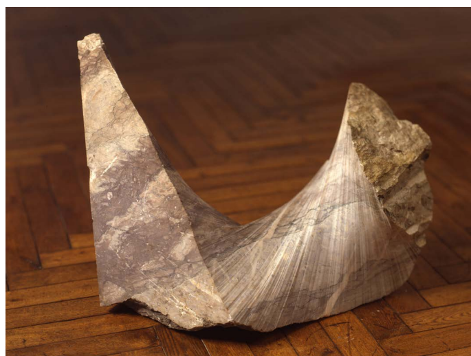
Peter Briggs, Cold Shoulder , 1981

À Angers, un premier espace installé dans la continuité des collections contemporaines du musée rassemble une vingtaine d'œuvres fondatrices provenant de collections publiques (Centre national des arts plastiques, Fonds régionaux d'art contemporain des Pays de la Loire, de Bretagne, d'Île de France et du Centre, Collection départementale d'art contemporain de Seine saint Denis, musée de La Roche sur Yon, et de plusieurs collections privées, complétées par des pièces de l'atelier de l'artiste.