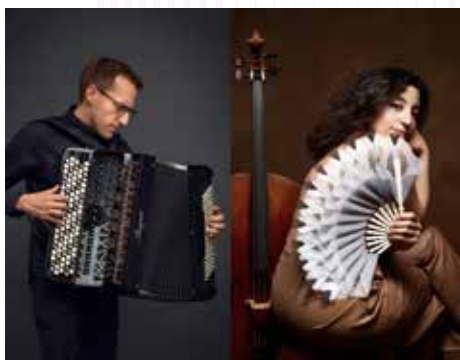
© M. Braun - F. Perrot