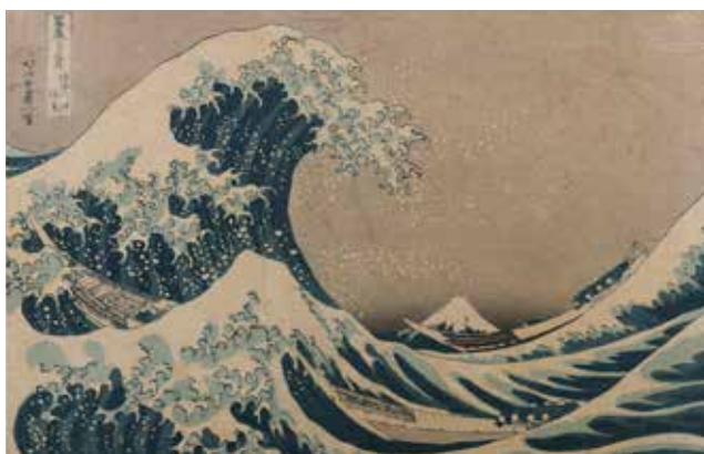
Katsushika Hokusai, La Grande Vague de Kanazawa , série Trente-six vues du Mont Fuji , 1890 (retirage), estampe, Musée Pincé

Le musée Pincé a vocation dans ses expositions temporaires à faire découvrir l'ensemble des collections des musées et de l'artothèque d'Angers. Un dialogue s'instaure ainsi entre les civilisations d'Orient et d'Occident dans un musée dont les fonds antiques et extra-européens, tournés vers l'ailleurs, invitent au voyage.