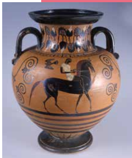
Amphore à figures noires à décor d'hoplite, Grèce, Attique - Peintre du B.M.N., atelier de Nicosthénès, vers 540-520 av. J.-C.

Des dépôts (prêts d'œuvres à long terme de la part d'autres musées), depuis la seconde moitié du xix e siècle, permettent également de compléter la collection. Ainsi, certains objets égyptiens, grecs, étrusques et romains proviennent du musée du Louvre ; certains objets asiatiques sont déposés par le musée des Arts décoratifs à Paris.