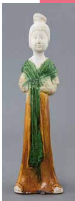
Statuette de dame de la Cour, Chine, dynastie des Tang (618-907), fin 7 e - début 8 e siècle ; tête moderne (?), terre cuite glaçurée de type sancai (trois couleurs).