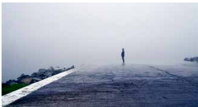
Franck Gérard, Sans titre , série La limite transversale de la mer , 2007, photographie, Artothèque © Adagp, Paris 2020

Exposition « La Mer » du 15 février au 20 septembre 2020