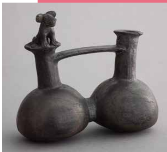
Vase siffleur géminé à anse en pont, Pérou - Culture Chimú, prov. Pacasmayo, Intermédiaire récent (11 e -15 e siècles), terre cuite