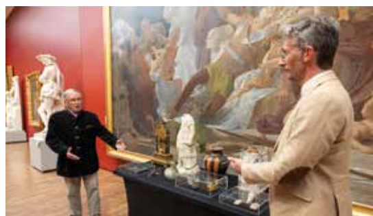
Donation Léveilley

En juillet, une partie de la donation fera l'objet d'une exposition au musée Pincé et au cabinet d'arts graphiques du musée des Beaux-Arts.