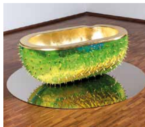
© Christophe Marchalot et Félia Fortuna, Le Bain, 2012

La Cité internationale de la tapisserie à Aubusson est invitée au Musée Jean-Lurçat et de la Tapisserie contemporaine pour exposer des œuvres originales se trouvant à la frontière des arts plastiques et du design, entre références au passé et innovations. La Cité internationale de la tapisserie, créée en 2009 après la reconnaissance de l'art de la tapisserie d'Aubusson comme « patrimoine immatériel de l'humanité » par l'UNESCO, est plus qu'un musée. Elle a pour mission de protéger le savoir-faire de tissage et d'en assurer la transmission à travers d'ambitieuses politiques de création. Centrée sur la création contemporaine, cette exposition met en lumière la nouvelle génération de créateurs et lissiers à Aubusson.