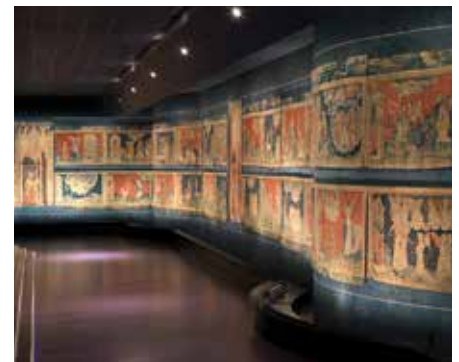
Galerie de l'Apocalypse, deuxième aile

Après l'inscription de la Tenture de l'Apocalypse d'Angers sur le registre de la mémoire du monde de l'UNESCO en mai 2023, le CIAP (Centre d'Interprétation de l'Architecture et du Patrimoine) met à l'honneur les biens inscrits sur cette liste. L'exposition sera l'occasion de découvrir les documents reconnus d'importance mondiale comme la Bibliothèque humaniste de Beatus Rhanus, ou l'exemplaire de Bordeaux des Essais annoté de la main de Montaigne.