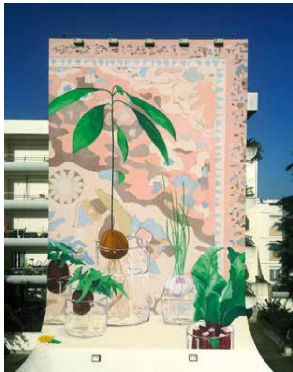
Mur 2 Pastel rue de la lande