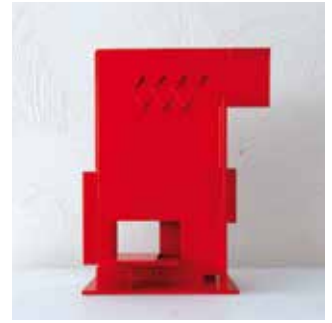
Folie © Pascal Proust

Le CIAP (Centre d'Interprétation de l'Architecture et du Patrimoine) accueille l'artiste sculpteur Pascal Proust. Dans son œuvre, l'artiste questionne notre relation à l'architecture, la ville et l'urbanisme. Il interroge par le biais de ses sculptures l'histoire réelle ou fictionnelle d'une société moderne : ses accords, ses désaccords, ses tentatives et ses réussites. On retrouve dans l'exposition sa sensibilité pour l'architecture, allant du dessin, avec Cité filaire, aux structures métalliques, avec Folies et La Cité . Ces œuvres abstraites permettent d'échapper à la réalité en provoquant le rêve.