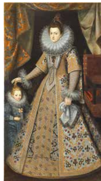
Franz Pourbus (copie d'après), Portrait de l'archiduchesse Isabelle Claire Eugénie, vers 1595-1605, Musée Tessé, Le Mans

Confrontant la représentation du vêtement dans des peintures, des dessins et des gravures de mode à des documents historiques, à des accessoires de mode ou à des éléments textiles, l'exposition aborde les questions relatives au vêtement dans un contexte volontairement large : les problématiques commerciales, sociales, économiques et même symboliques sont au cœur du projet. Des répliques de costumes y sont présentées afin d'aider le public à comprendre les différentes textures et la disposition des habits.