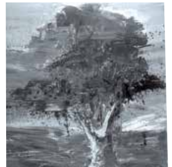
Paysage international, lieu du crime - huile sur toile - Pei-Ming, détail

Exposition en partenariat avec le FRAC des Pays de la Loire.