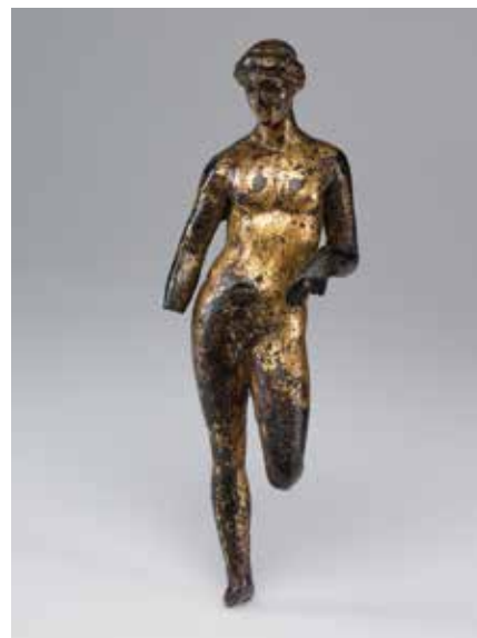
Statuette d'Apollon, bronze doré, Angers, Antiquité gallo-romaine

Cette exposition est réalisée à l'occasion du congrès international de la SFECAG, Société française d'études de la céramique antique en Gaule, organisé à Angers du 9 au 12 mai 2024.