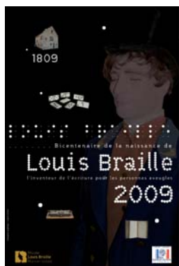
Affiche format 40x60cm