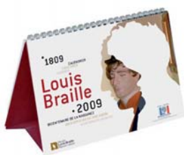
Calendrier 2009 format 21x15cm