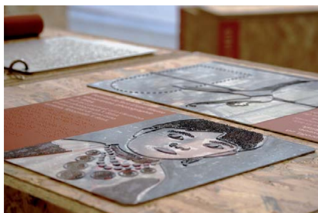
image en relief