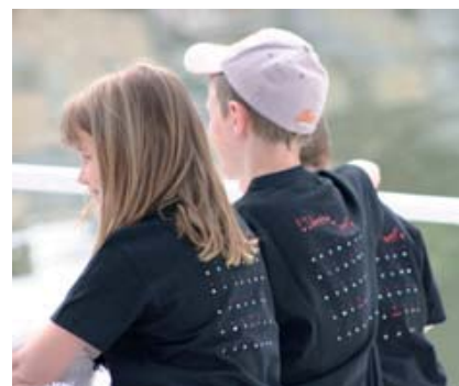
T-shirt enfant adultes Impression de texte braille en relief.