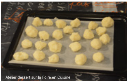
Atelier dessert sur la Foire en Cuisine