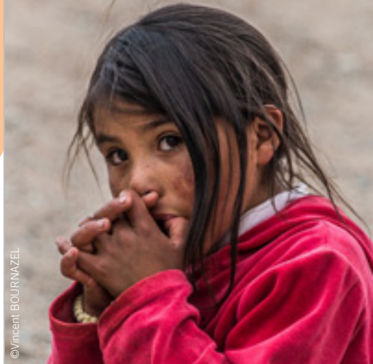
Photo de l'expo « Rencontres au bout du Monde » de Vincent BOURNAZEL.