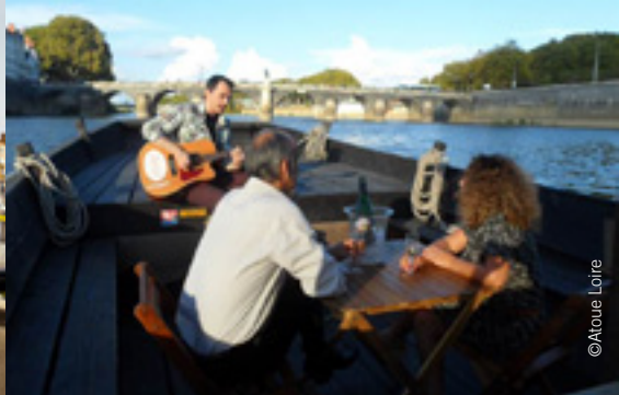
Atoue Loire (tourisme fluvial)