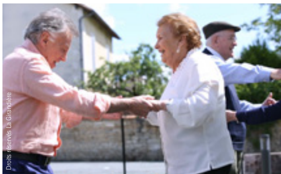
Résidence La Girandière