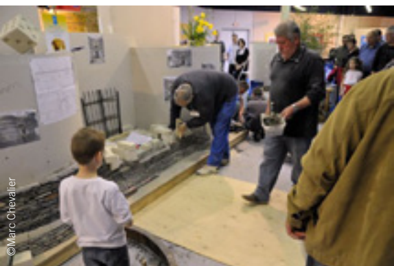
Ateliers et démonstrations par l'Outil en Main