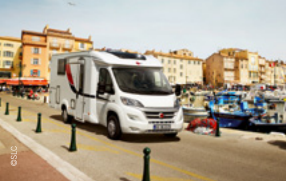
Voyages en camping car avec la FFCC, voir page 14