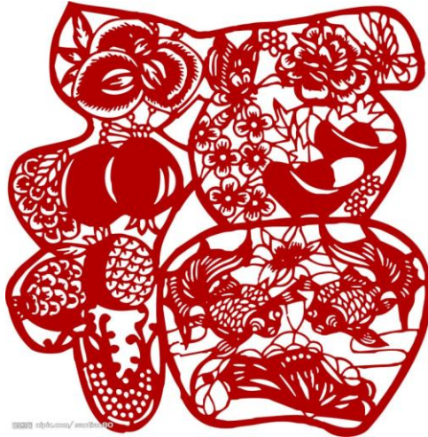
Le caractère 福 (fu : bonheur) en papier découpé.

L'après-midi du 2 février, la place du Ralliement vibrera au rythme du Nouvel an chinois !