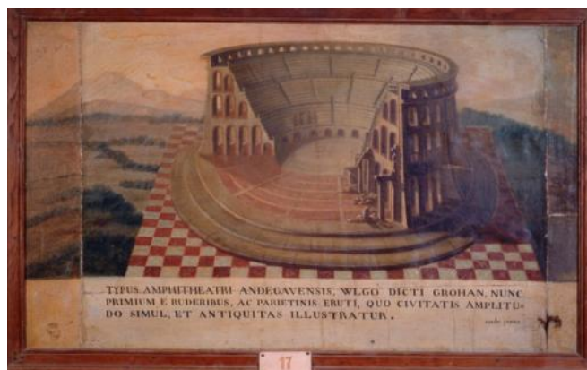
Les arènes de Grohan par M.-L.-C. Coulet de Beauregard, huile sur toile, collection musée des Beaux-Arts d'Angers / Photo Pierre David.