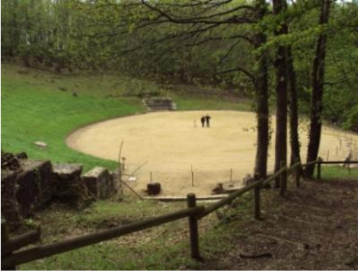
Vue de l'arène de l'amphithéâtre de Gennes.