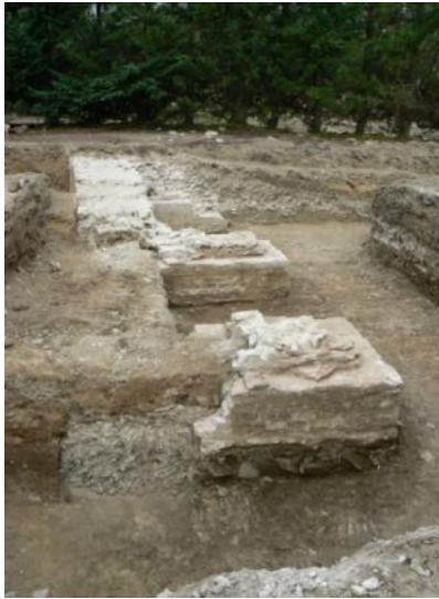
Les contreforts du mur extérieur du théâtre de Sainte-Gemmes-sur-Loire dégagé en 2012.