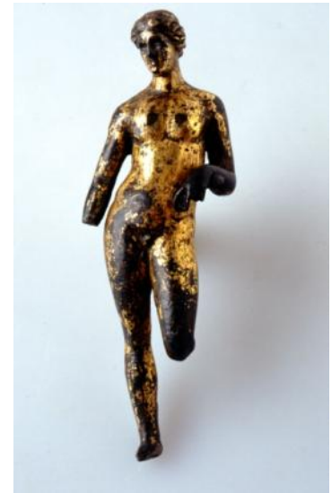
Apollon , bronze doré découvert dans les arènes de Grohan d'Angers en 1812, collection musée des Beaux-Arts d'Angers / Photo Pierre David.