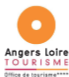
Angers Loire Tourisme