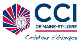
La Chambre de Commerce et d'Industrie