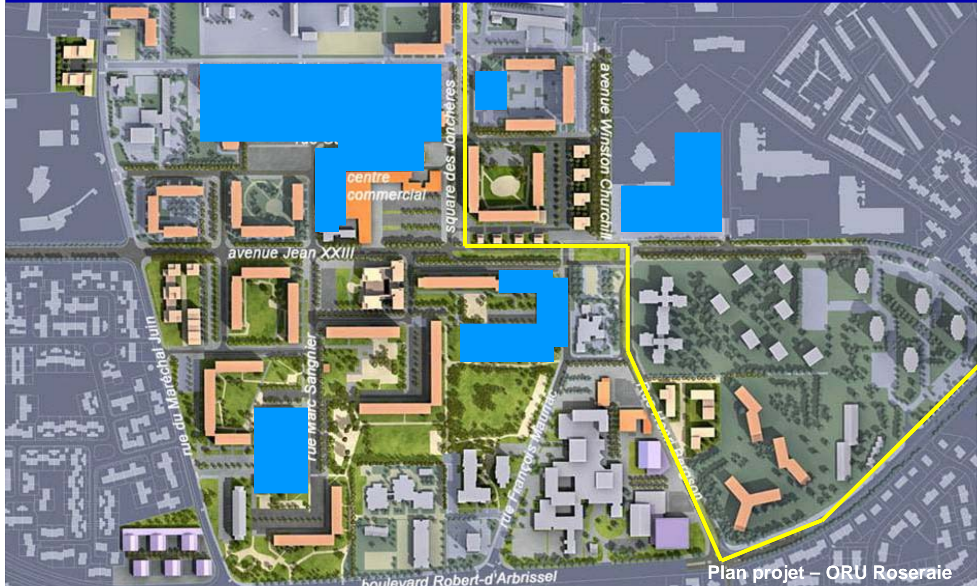
Plan projet – ORU Roseraie