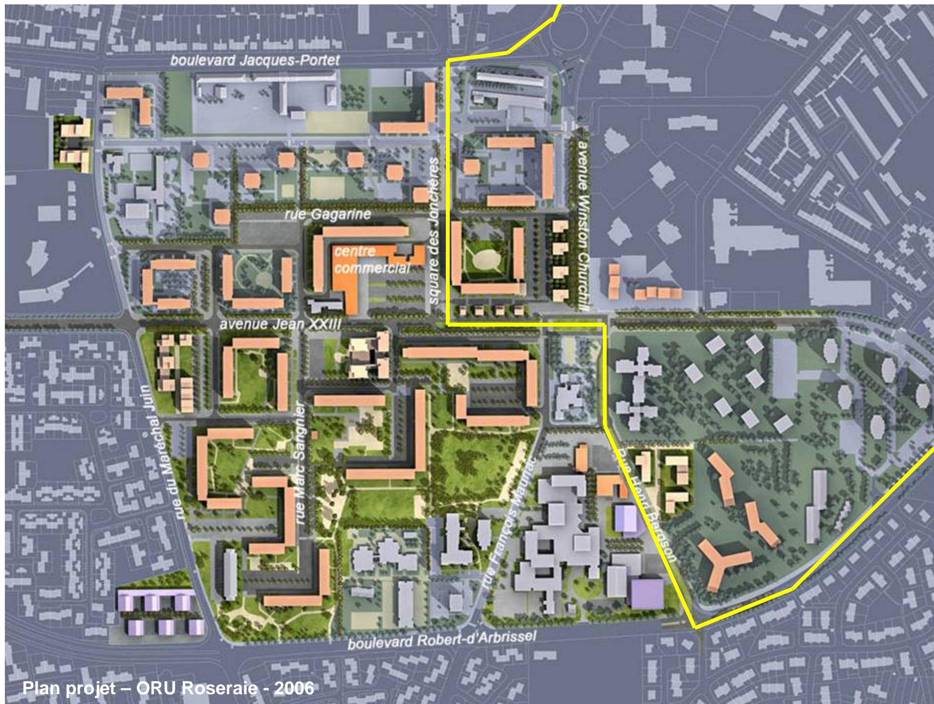
Plan projet – ORU Roseraie - 2006