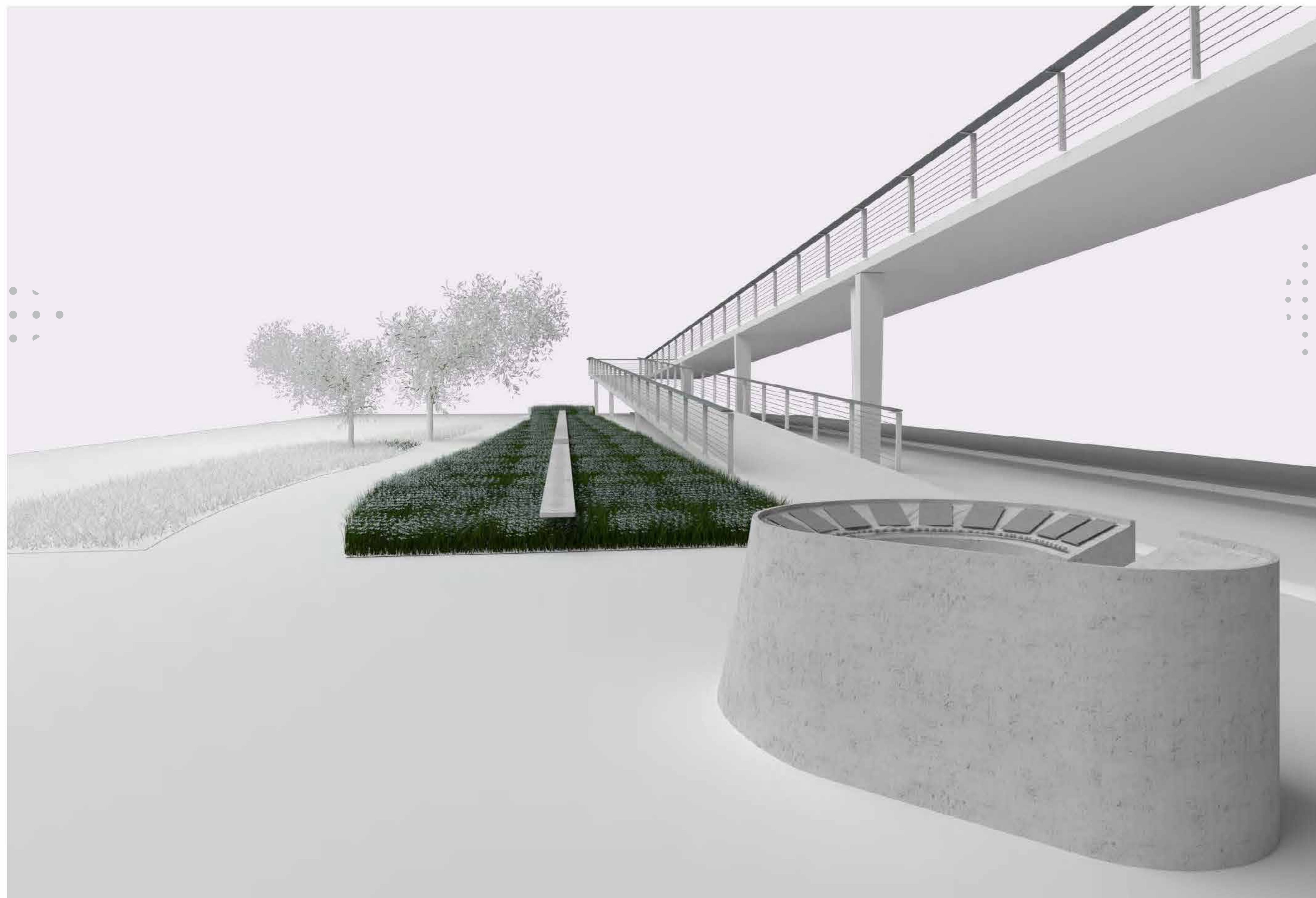
Vue depuis la place Giffard-Langevin. L'œuvre est longue de 64 m, inclinée et entourée de végétal.

À quelques mètres de ce ruban, une table reprend l'ensemble des informations liées à l'œuvre, le contexte historique et son inscription dans l'environnement urbain.